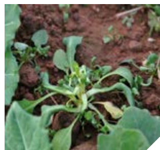
Tobołki polne 7 dni po aplikacji