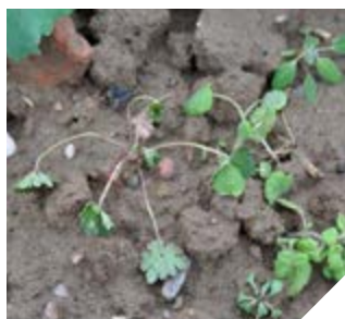
Bodziszek drobny 2 dni po aplikacji