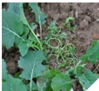
Dymnica pospolita 1 dzień po aplikacji