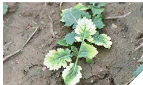
Typowy obraz uszkodzeń rzepaku po zastosowaniu herbicydu zawierającego chlomazon

Wariant powschodowy niesie ze sobą także inne korzyści w porównaniu do zabiegów posiewnych, ponieważ wykonujemy go już po dokonaniu oceny wschodów rzepaku, jak i rodzaju oraz stopnia zachwaszczenia. W przypadku rozwiązań doglebowych stosowanych do trzech dni po siewie, herbicydy stosujemy niejako w ciemno, nie wiedząc jaki będzie finalny stan wschodów rzepaku, a w przypadku trudnych warunków pogodowych nie mamy gwarancji, że plantacja będzie dobrze rokowała. W takiej sytuacji, aplikacja posiewna ogranicza dobór potencjalnej rośliny następczej, kiedy już podejmiemy decyzję o konieczności przesiewu.