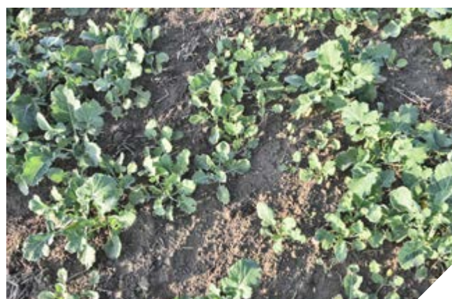
LaDiva™ 0,25 l/ha